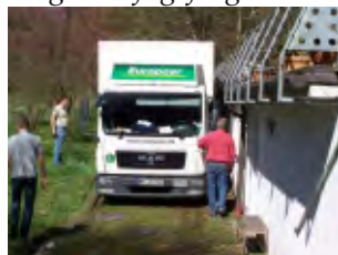
Ab die Post