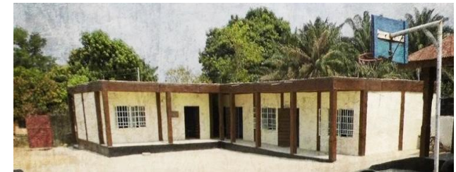
Schule unseres Partner-CVJM in Bo, Sierra Leone